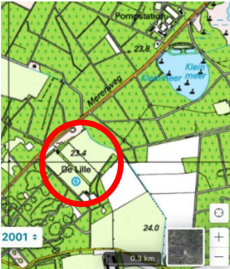
2024 Huidig sportpark