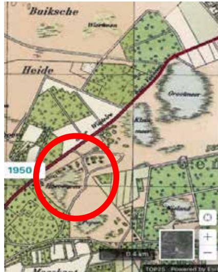
1950 Droog Hoeven Ven