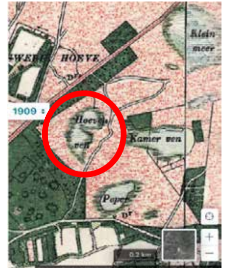
1900 Hoeven Ven